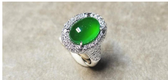
两件精美玻璃种帝王绿翡翠，出于20世纪60年代初在山卡矿区开采的“权玉”翡翠毛料的精品。