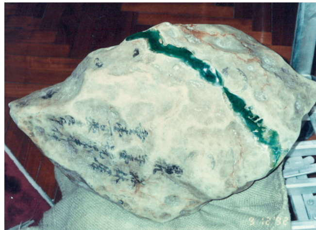
“权玉”——李氏家族开采的里程碑意义的翡翠原石之一，重约61公斤。

除了翡翠玉石，李生泽还经营一种在缅甸开采的名为“莫湾基翡翠”（maw-sit-sit）的材料。1963年，他邀请著名宝石学家爱德华·古宝琳（Eduard Joseph Gübelin）博士（1913年—2005年）访问抹谷，研究这种宝石材料。（《宝石学杂志》，1965年）