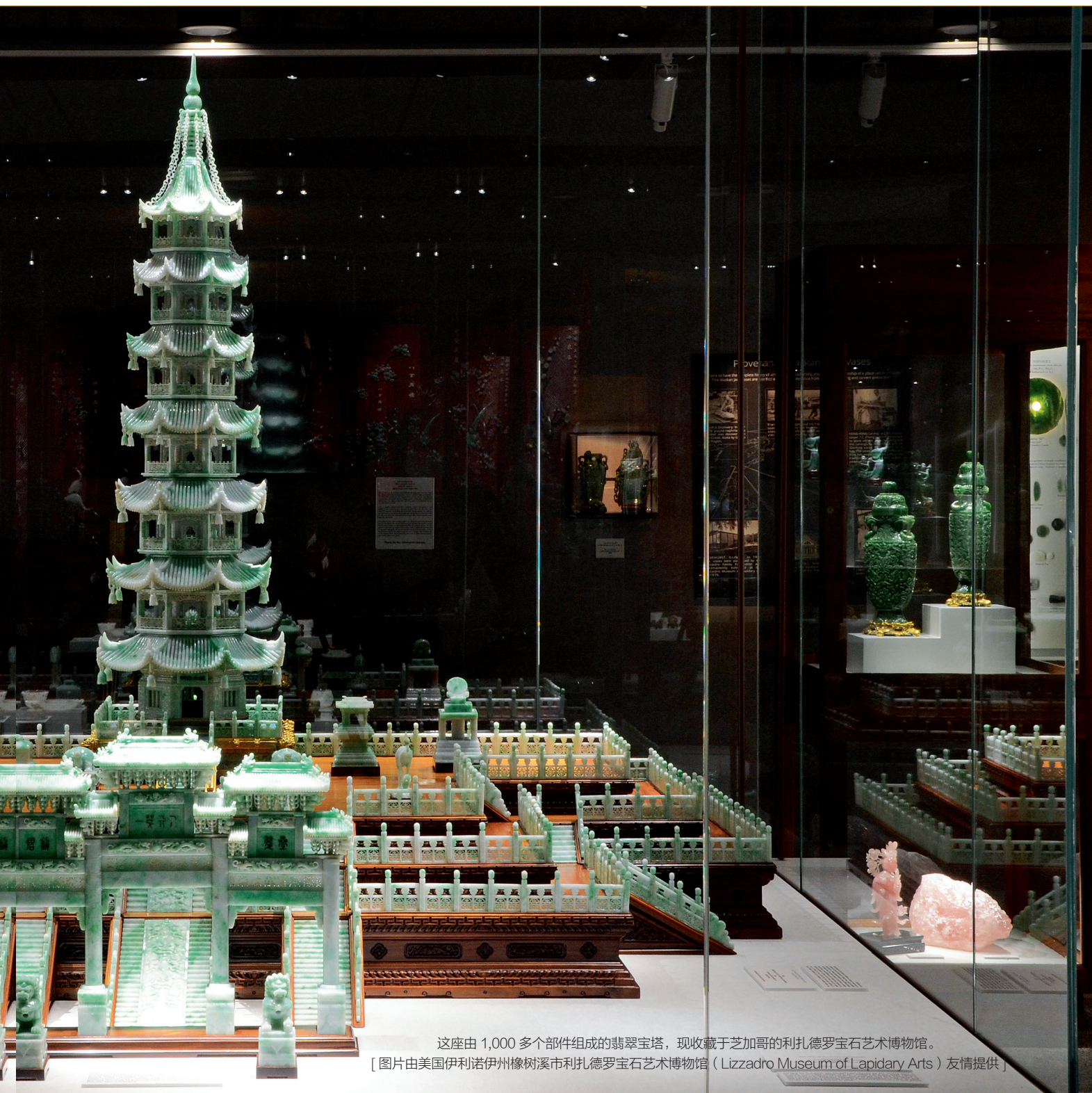
这座由 1,000 多个部件组成的翡翠宝塔，现收藏于芝加哥的利扎德罗宝石艺术博物馆。

玉 器贸易和制造是中国香港历史最悠久的行业之一。然而，1965年6月5日美国政府对从中国香港制造的玉石及半宝石制成品实施禁运条例，造成香港玉石行业每年2千万美元的收入损失和大量裁员，时任香港工商处副处长的麦理觉（J. D. McGregor）建议香港同业团结，集合众商人之力与美国政府洽谈如何解禁，香港玉石制品厂商会应运而生，于同年7月2日获准注册成立，并于9月22日举行首次会议。