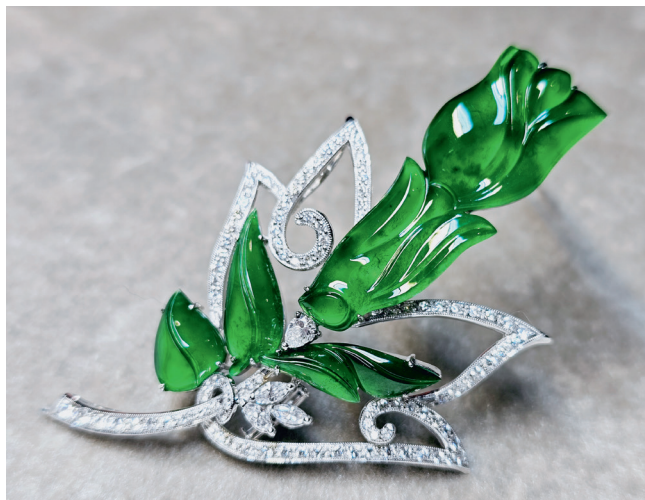
李氏家族收藏的玻璃种帝王绿翡翠胸针 出自该家族 20 世纪 60 年代初在山卡(Sanka)矿区开采的“权玉”翡翠毛料精品。

1962年，缅甸玉矿被国有化后，当地的经营环境发生重大改变，李昌德将总部迁往香港和曼谷。李生泽家族通过裕丰公司和其它实体继续经营缅甸翡翠。凭着他们的努力，裕丰公司